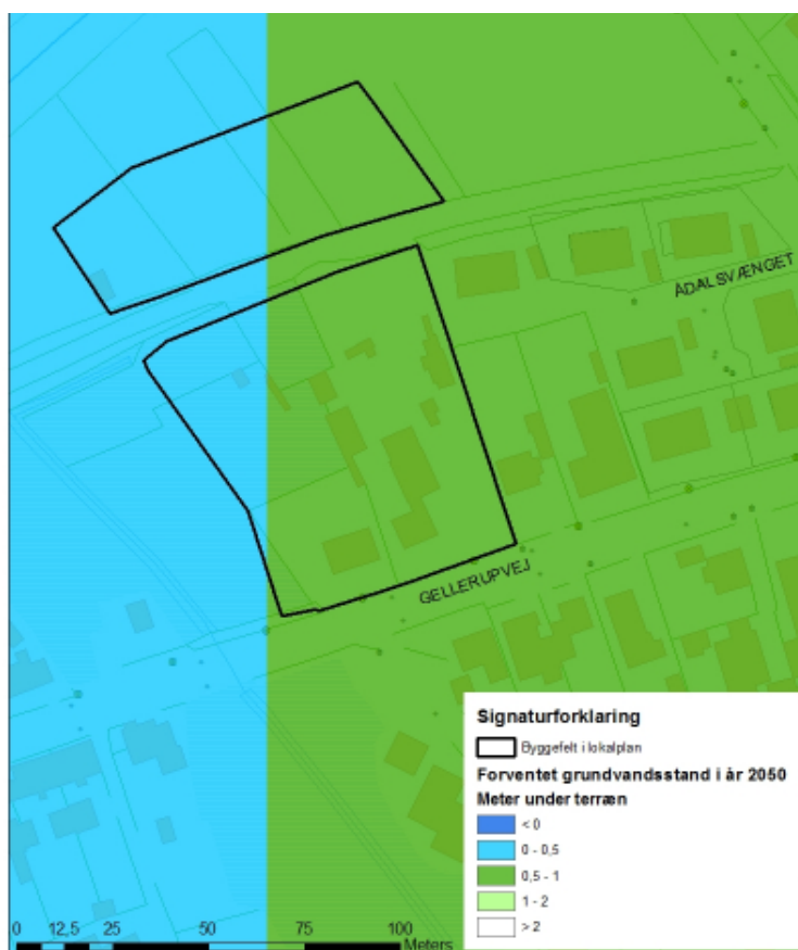
Figur 2: Grundvandskort, der viser den forventede grundvandsstand i år 2050.

Grundvandskortet på figur 2 viser, hvilke områder, hvor grundvandet i 2050 vil stå ved eller nær jordoverfladen. Det vil sige, at grundvandskortet viser områder, hvor der potentielt vil være problemer med højtstående grundvand.