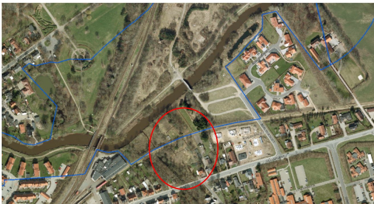
Den blå linje viser åbeskyttelseslinjen, mens den røde figur viser placeringen af lokalplanområdet.

Forvaltningen vurderer dispensationsansøgning i forbindelse med fremsendelse af et konkret projekt. Udfaldet af en klage over kommunens eventuelle dispensation fra å-beskyttelseslinjen kan i sagens natur ikke foruddiskonteres.